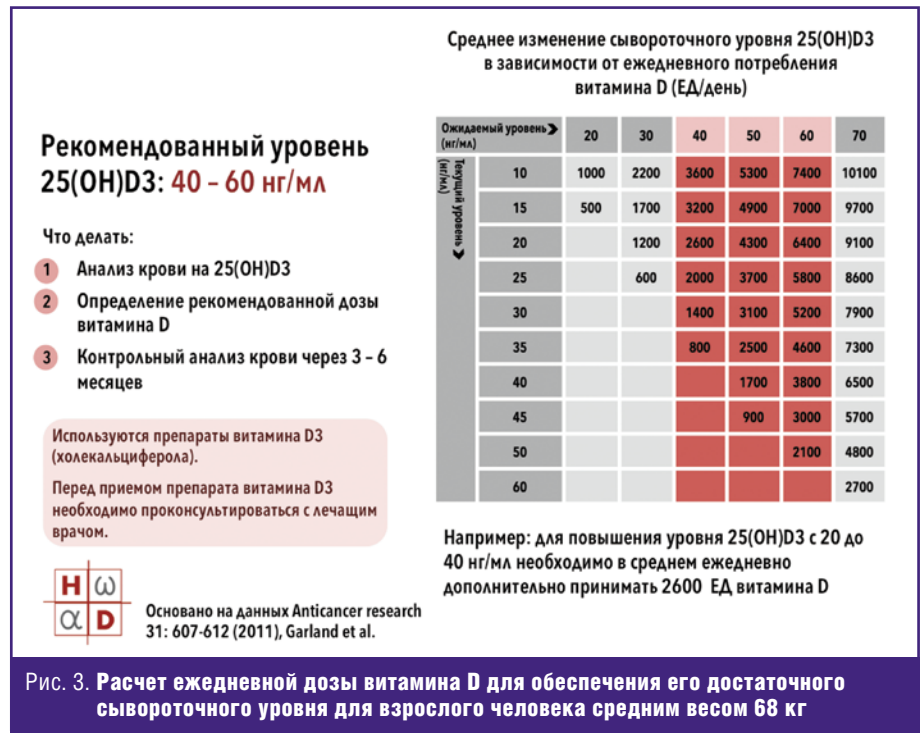
Рис. 3. Расчет ежедневной дозы витамина D для обеспечения его достаточного сывороточного уровня для взрослого человека средним весом 68 кг

Для лечения недостаточности и дефицита витамина D традиционно используются препараты холекальциферола (витамина D 3 ). Схема подбора дозы препарата витамина D 3 в зависимости от исходной концентрации 25(OH)D3 приведена на рис. 3. Следует отметить, что применение препаратов витамина D 3 является абсолютно безопасным, так как данная форма витамина D является неактивной и под-